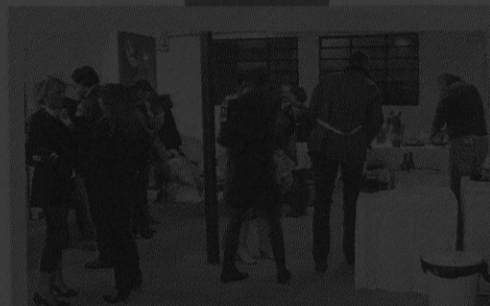
A SAN BELLINO. Uno scorcio della galleria